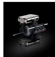
VXD (音圈高转矩驱动): 线性马达对焦机构 VXD

AF 驱动中采用了线性马达对焦机构 VXD 1 。在发挥优秀响应性能的同时，可高速、高精度地工作。A063 的 AF 速度是初代产品 A036 的约 2 倍 2 ，从最近拍摄距离到无穷远，可轻松快捷地进行合焦，帮助您留住重要一刻。在静音性方面，由于马达驱动音小，对于安静环境下的照片及视频拍摄也非常合适。