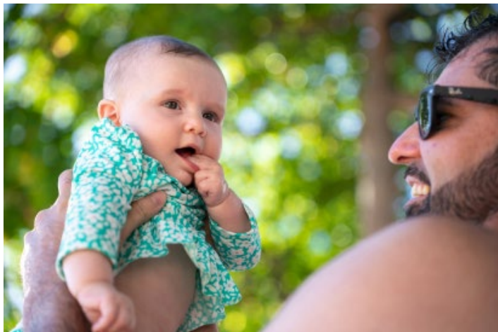
使用相机: Sony α7R III 焦距: 75mm 曝光: F2.8 1/200秒 ISO100

28-75mm F/2.8 Di III VXD G2 (型号 A063) 是一支适用于全画幅无反相机的索尼 E 卡口大光圈标准变焦镜头。作为获得市场高度评价的28-75mm F/2.8 Di III RXD (型号 A036) 的后续型号，一大进化便是其高精度的清晰画质。我们在保持 A036 紧凑外观尺寸的基础上，重新对 A063 的光学系统进行了设计。特殊材质镜片与非球面镜片分别配置于恰当的位置，大幅抑制各种像差的产生。镜头全焦段从画面中心到周边拥有锐利的表现性能，同时还能体验大光圈的柔美虚化效果。A063 将成为腾龙第二代常备镜头，为您进一步增添摄影乐趣。